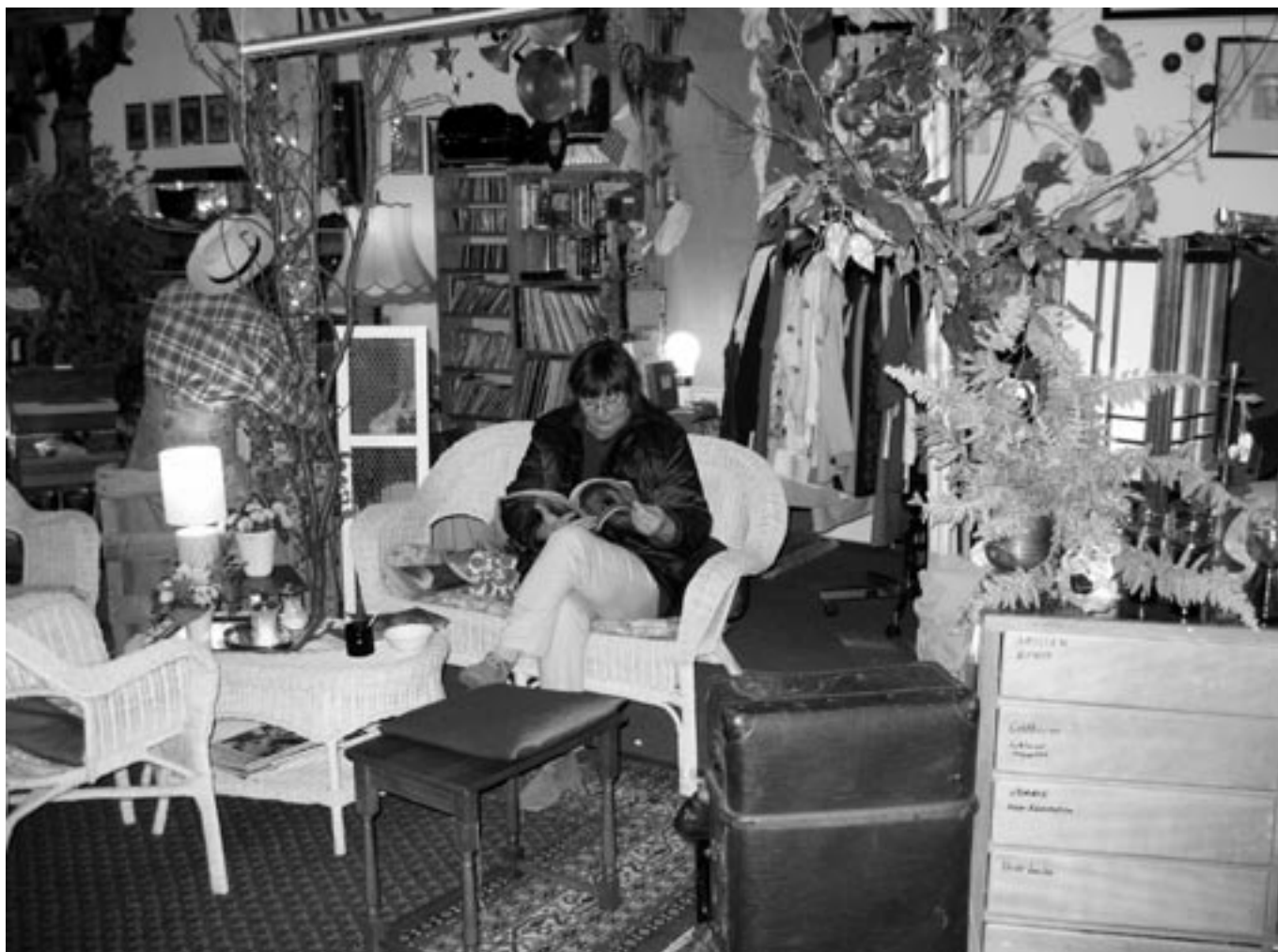
Ein gemütlicher Trödelladen ist der Second-Hand-Shop der Nieder-Ramstädter Diakonie in Mühlthal: Mittendrin gibt es das „Wohnzimmer“ zum Ausruhen und Kaffeetrinken.

Der Trödelladen der NRD in Mühlthal schafft Arbeitsplätze für behinderte Menschen