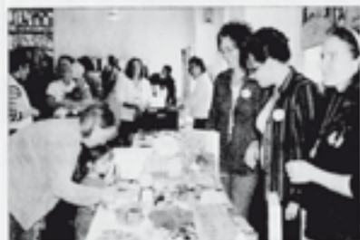
Der „Markt der sozialen Möglichkeiten“ regte zu einem lebhaften Austausch an.

Die Podiumsteilnehmer zogen ein positives Fazit der Veranstaltung. Kontakte sind entstanden. Ideen wurden ausgetauscht. Es blieb der Wunsch, die eigene Arbeit weiter zu optimieren und sich einen Tag nochmals zu wiederholen. Tatjana Steindorf