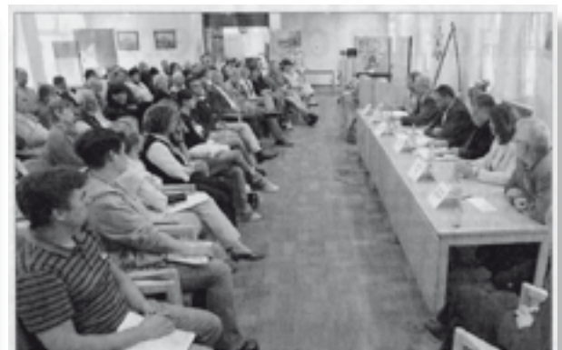
Im Ratssaal von Westerbürg erläuterten die Podiumsteilnehmer nacheinander ihre sozialen Dienstleistungen. Es entstanden viele Kontakte. Das Fazit war positiv.