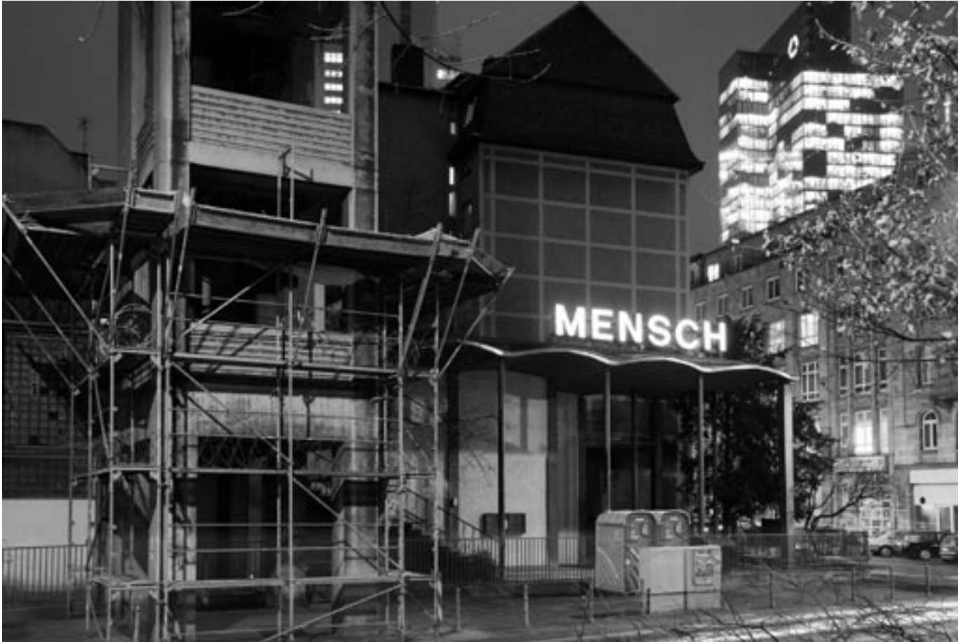
Leuchtschrift MENSCH an der Weißfrauen Diakoniekirche im Frankfurter Bahnhofsviertel.

Last Supper in der Frankfurter Diakoniekirche