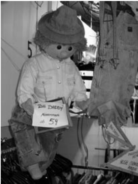
Die witzige und liebevolle Dekoration ist ein Markenzeichen des NRD-Shops.