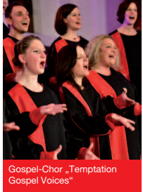
Gospel-Chor „Temptation Gospel Voices“

Erleben Sie mit vielen Ehrengästen, großartiger Musik und wagemutigen Cocktails, warum der Auftritt Martin Luthers auf dem Reichstag zu Worms bis heute Menschen inspiriert.