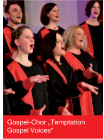
Gospel-Chor „Temptation Gospel Voices“

Erleben Sie mit vielen Ehrengästen, großartiger Musik und wagemutigen Cocktails, warum der Auftritt Martin Luthers auf dem Reichstag zu Worms bis heute Menschen inspiriert.